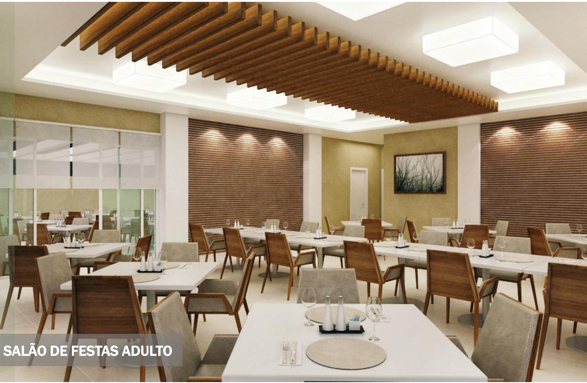
SALÃO DE FESTAS ADULTO