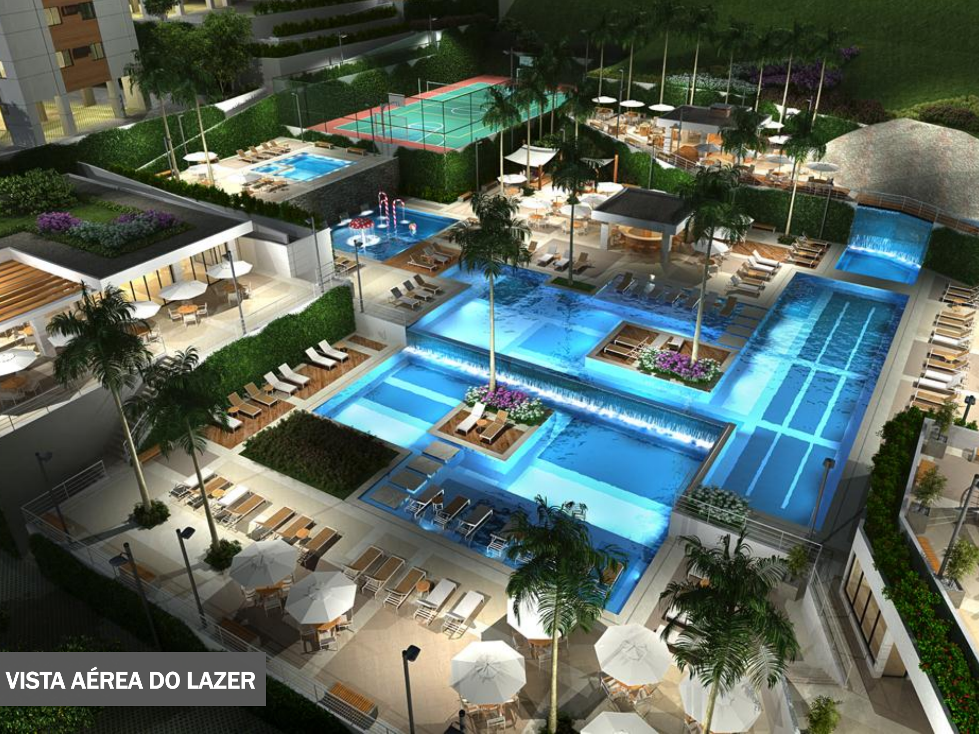
VISTA AÉREA DO LAZER