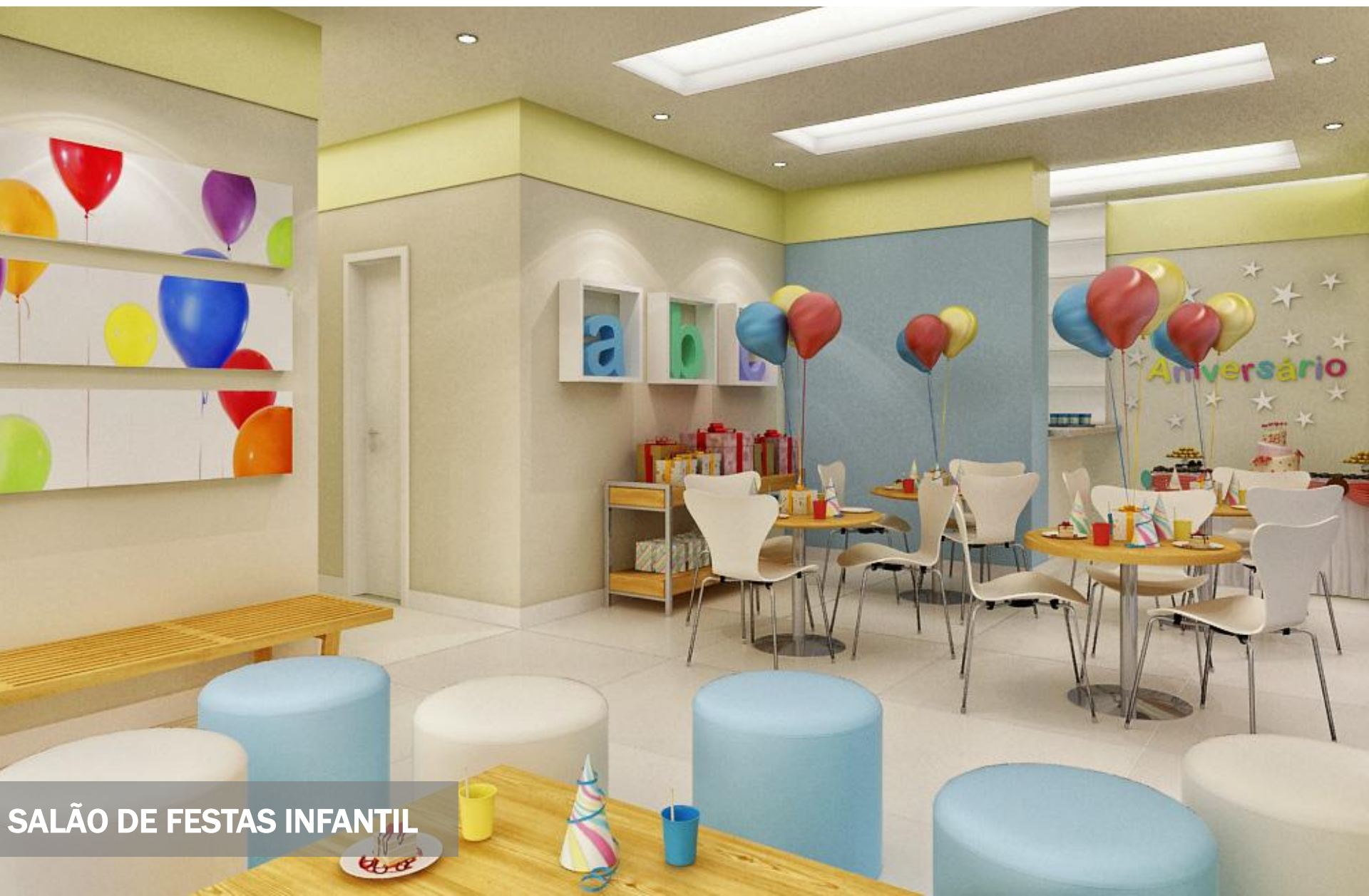
SALÃO DE FESTAS INFANTIL