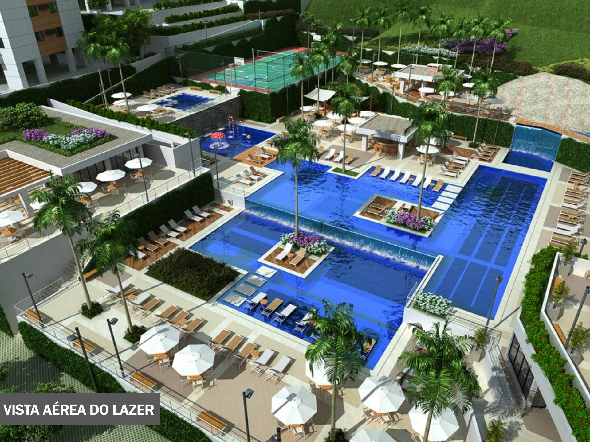
VISTA AÉREA DO LAZER